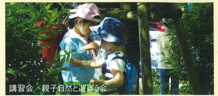
講習会 / 親子自然と遊ぼう会