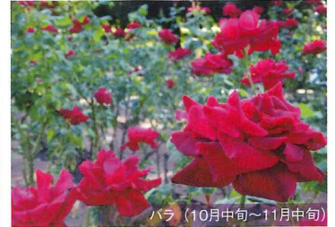
バラ (10月中旬～11月中旬)