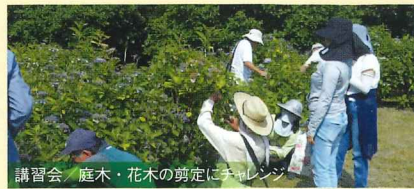
講習会 / 庭木・花木の剪定にチャレンジ

庄内緑地では季節に合わせた旬なイベントや、 展示会、講習会、親子で楽しめる企画など盛りだくさん!