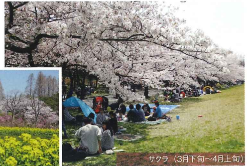
サクラ (3月下旬～4月上旬)