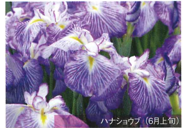
ハナショウブ (6月上旬)