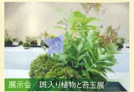
展示会 / 斑入り植物と苔玉展