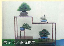
展示会 / 東海雅展