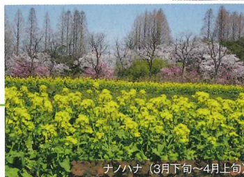
ナノハナ (3月下旬～4月上旬)